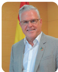
Pere Granados Carrillo Alcalde de Salou

Estem plenament convençuts que aquesta programació corresponent al Salou Actiu per als nostres veïns i veïnes sènior tindrà un bon impacte i una bona resposta. I desitgem que esdevingui una bona eina de sociabilització i d'intercanvi d'experiències, relacions i coneixements.